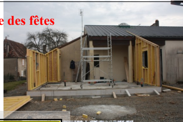
Salle des fêtes