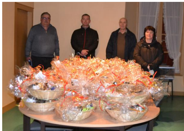
Prêts pour la distribution des colis !!!

Suite aux conditions sanitaires, en remplacement du repas de l'amitié, le conseil municipal a proposé des colis gourmands aux aînés de plus de 65 ans. Ces colis de produits locaux confectionnés par la Maison du Fromage de Poulligny St Pierre ont été distribués par M. le Maire et les conseillers au début du mois de janvier. Nos aînés ont été ravis de recevoir une petite visite et se sont régalés !