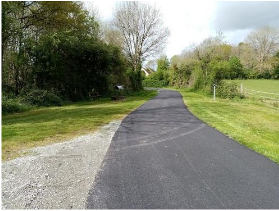
Rue des Granchaumes

Chaque année, la commune consacre une partie du budget à l'entretien des voies et routes communales. La réfection de la rue des Granchaumes, programmée en 2020 mais réalisée en début d'année, a coûté 29 622 euros.